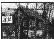
Gårdsbilder sammenstilt med personbilder