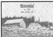
Gårdsbilder med informasjon