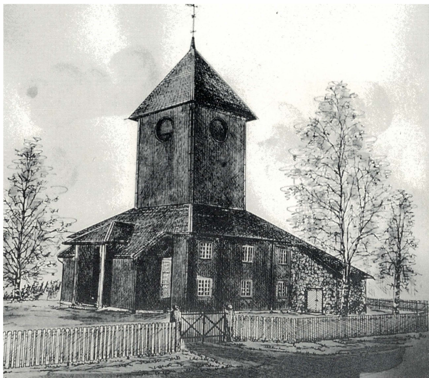
Ål kirke i Gran, tegnet i 1978 av I. Andresen. Se artikkel side 49.

Nr. 1 1997 Årgang 15 Pris kr. 40,- ISSN: 0802-860